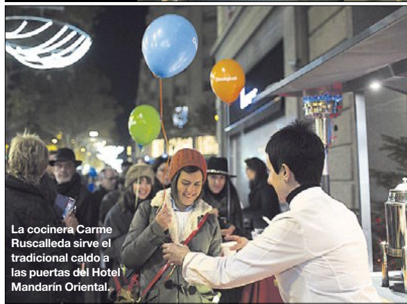
La cocinera Carme Ruscalleda sirve el tradicional caldo a las puertas del Hotel Mandarin Oriental.