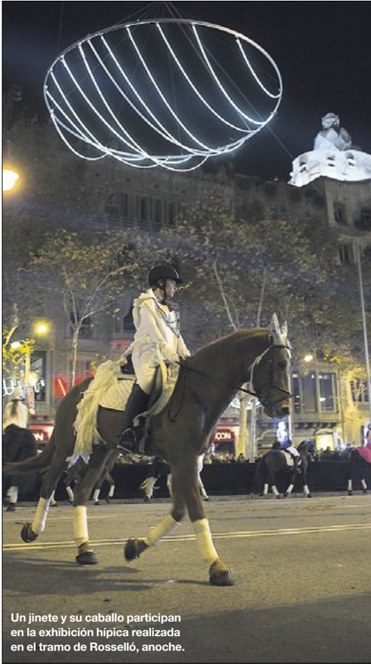
Un jinete y su caballo participan en la exhibición hípica realizada en el tramo de Rosselló, anoche.