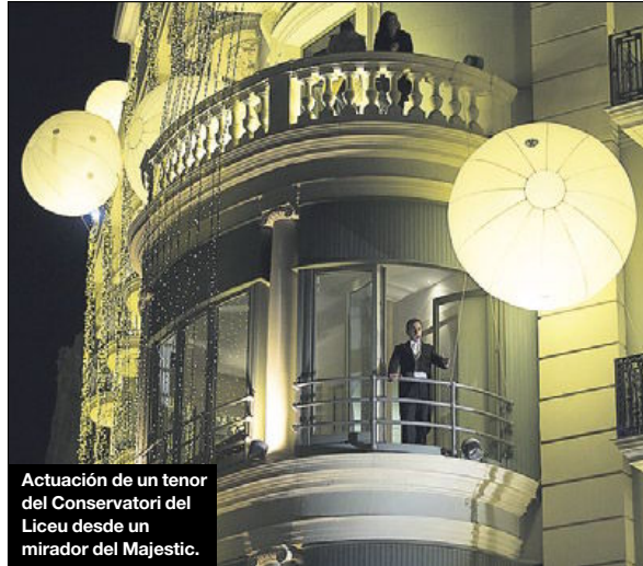
Actuación de un tenor del Conservatori del Liceu desde un mirador del Majestic.