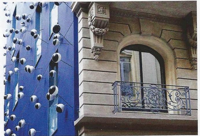
☛ SANTA EULALIA, Passeig de Gràcia, 93. Tél. +34 932 150 674. www.santaeulalia.com