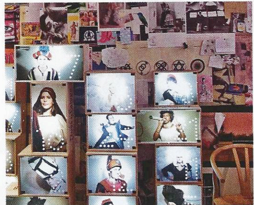
☛ KOMOMOTO, Princesa, 35. Tél. +34 933 152 504. www.grupotragaluz.com

C e restaurant est sans doute l'un des rares en Europe à proposer la dégustation de cuisine nikkei. Développé par les migrants japonais au Pérou depuis le XIX e siècle, ce genre culinaire se goûte ici sur de grandes tables d'hôte dans une atmosphère arty chic. O.R. KOMOMOTO offers large communal tables, an arty-chic ambience and, a rarity in Europe, Nikkei cuisine, the culinary genre developed by Japanese immigrants in Peru.