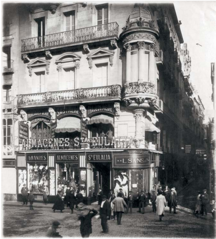
El primer establecimiento de Santa Eulalia se encontraba en el Pla de la Boquería, en Barcelona. Esta imagen corresponde al año 1920.

Luego llegaron los 70 con sus vestidos largos y sus psicodélicos estampados. España se abrió a la moda que venía de fuera y en Santa Eulalia pronto empezaron a adquirir colecciones firmadas por diseñadores internacionales. Paulatinamente, los talleres fueron prescindiendo de personal y el modelo de negocio tuvo que reestructurarse. “Mi familia al completo se ha sentido siempre muy identificada con