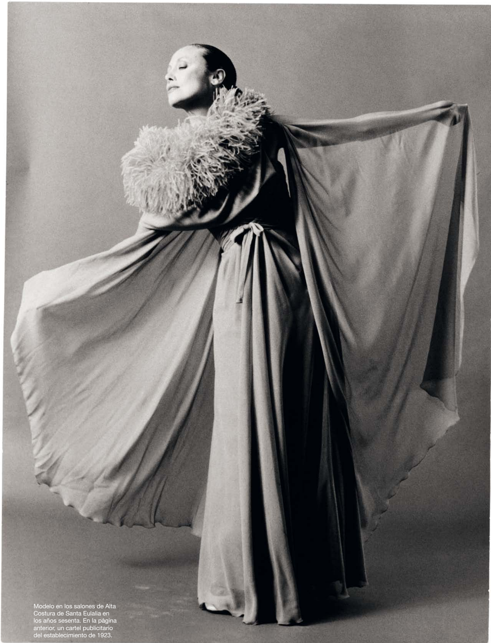
Modelo en los salones de Alta Costura de Santa Eulalia en los años sesenta. En la página anterior, un cartel publicitario del establecimiento de 1923.